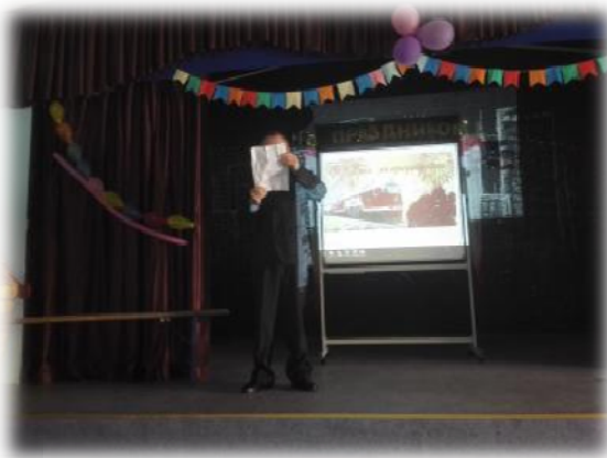
Масштабное мероприятие , посвященное дню железнодорожника , игры , загадки , чтение стихов , дискотека.